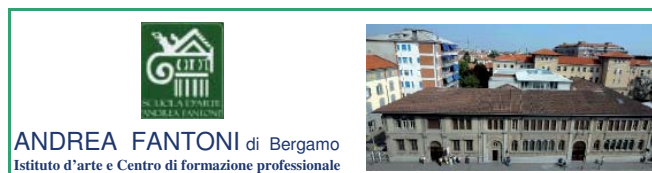
ANDREA FANTONI di Bergamo Istituto d'arte e Centro di formazione professionale