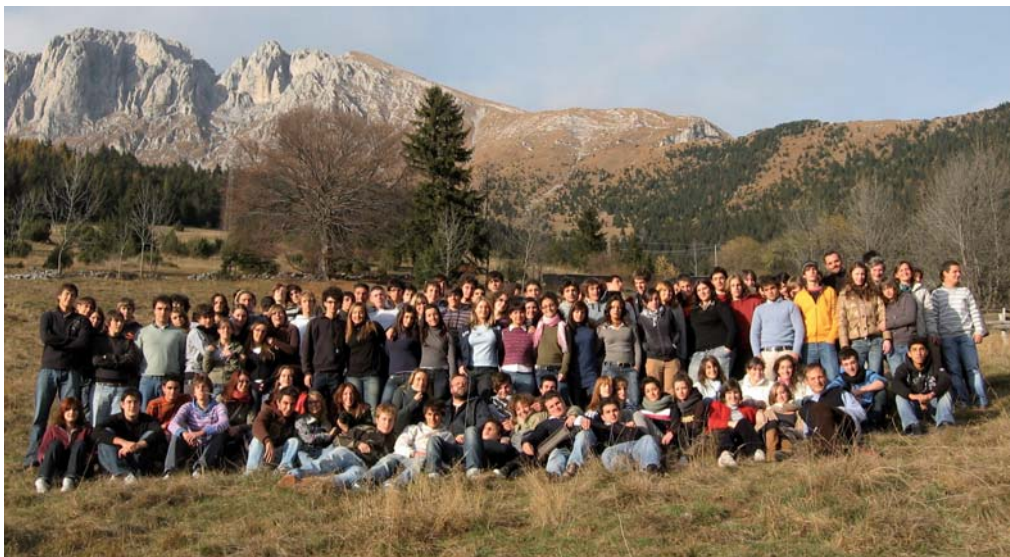
I ragazzi della Consulta Provinciale Studentesca di Bergamo 2007/2008 riuniti in quota, al Passo della Presolana.

"Cittadini del mondo, siamo tutti pietre preziose" dicono gli oltre cento adolescenti della nuova Consulta provinciale studentesca di Bergamo 2007/2008 (Cps – web www.consultastudenti.bg.it ) che con questo motto si sono riuniti in quota, al Passo della Presolana, per trasformare in progetti i sogni loro e dei 43 mila studenti e studentesse delle scuole superiori orobiche, statali e paritarie. La Consulta studentesca - con sede insieme allo "Sportello Scuola e Volontariato" presso l'Istituto superiore per i Servizi sociali di Bergamo (in via Brembilla, 3) - è l'unico organismo apartitico e istituzionale di rappresentanza studentesca su base provinciale, composto da due studenti per ogni istituto superiore bergamasco.